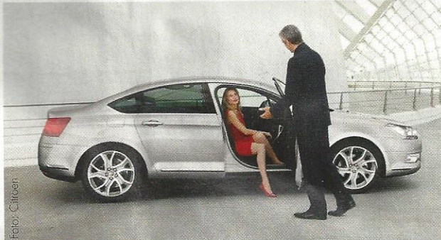
Der neue Citroen C5: Der Inbegriff eines französischen Grand-Charmeurs steht im Autohaus Fior bereit.

Ab 24.200 Euro beginnt eine Fahrt mit Eleganz & Dynamik. Um diesen Preis bekommt man den neuen Citroen C5 in der 1.8i Benziner Variante mit 125 PS. Den französischen Charmeur gibt es jedoch nicht nur als Limousine, sondern auch als Tourer. Der Kombi überzeugt nicht nur mit der-